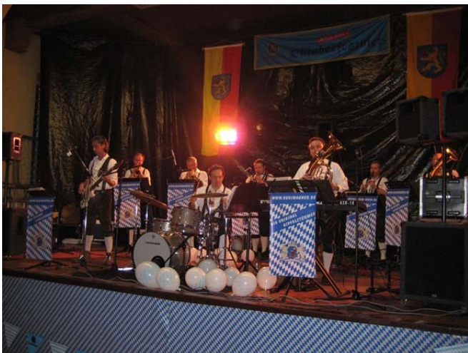
„Die Original Gipfelstürmer“

Sie haben es schon wieder geschafft! Im dritten Jahr in Folge heizte die Oktoberfest & Wiesn-Kapelle „Die Original Gipfelstürmer“ den Gästen des Bischheimer Oktoberfestes ordentlich ein. Aber wie es scheint, sind umgekehrt auch die Musiker ganz angetan vom Bischheimer Publikum, denn dieses Jahr brachten Sie eigens einen Kameramann mit, der die Stimmung im „Festzelt“ einfing. Gerade dieser großartigen Atmosphäre ist es wohl zu verdanken, dass die Veranstaltung bereits wenige Tage nach Eröffnung des Kartenvorverkaufs ausverkauft war.