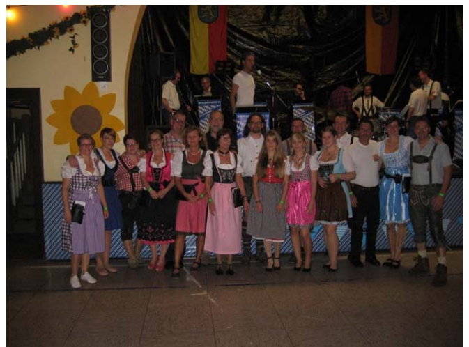
Nur einige der vielen diesjährigen Helfer beim Oktoberfest

Das Löwenbräu Oktoberfestbier floss reichlich. Zu den Stoßzeiten kamen die vielen Helfer ganz schön ins Schwitzen, sei es an der Zapfanlage, in der Küche oder mit jeder Menge Maß-Krügen in den Händen. Geübt aus den Vorjahren lief aber alles glatt, so dass die Besucher nicht auf dem Trockenen saßen und zügig mit Weißwürsten und Brez'n oder Leberknödel auf Sauerkraut versorgt werden konnten.